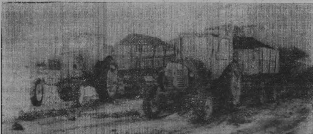
Вывозка торфа с Альцевского болота.