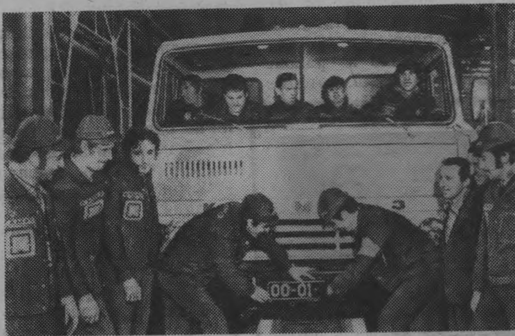
Набережные Челны. На Камском автомобильном заводе включен главный конвейер. Со сборочной линии начали сходиться трехосные тягачи модели «5320», снабженные 210-сильным дизелем. Конвейер действует в пусконаладочном режиме.

Выпуск первых серийных автомобилей с маркой «КамАЗ» — хороший подарок многотысячного коллектива строителей, монтажников, специалистов XXV съезду КПСС.