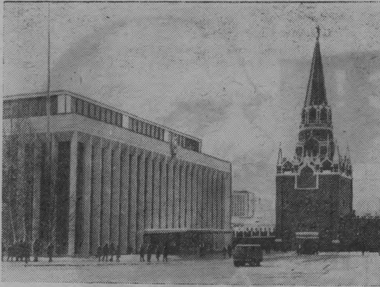
Москва. Кремлевский Дворец съездов и Троицкая башня.