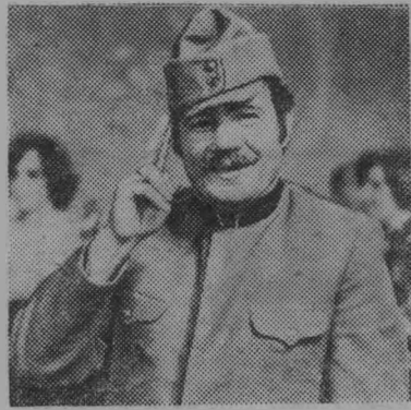
Москва. Для участия в новогоднем «Голубом Огонь-