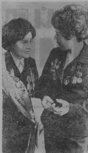
Государственной премии СССР.