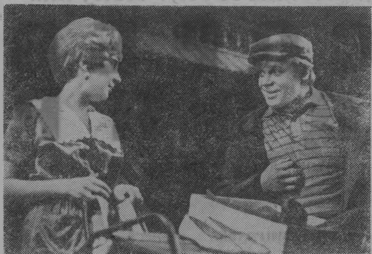
Москва. «Беседы при ясной луне» — так называется новый спектакль Государственного академического Малого театра Союза СССР. Это инсценировка рассказов из колхозной жизни лауреата Ленинской премии Василия Шукшина.

Автор сценической композиции и режиссер спектакля — В. Иванов, оформление заслуженного художника РСФСР П. Новодержкина, работавшего с Шукшиным над его фильмами, музыка заслуженного артиста РСФСР А. Паппе.