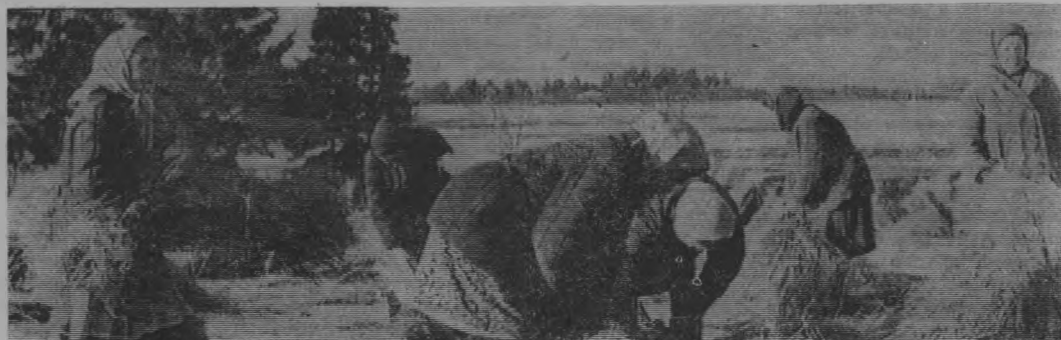
Хорошо идет работа со льном на полях колхоза имени Кирова. Из 130 гектаров поднято в конуса с 96 га. Продано государству 46 тонн тресты. На снимке: подъем льна в конуса.