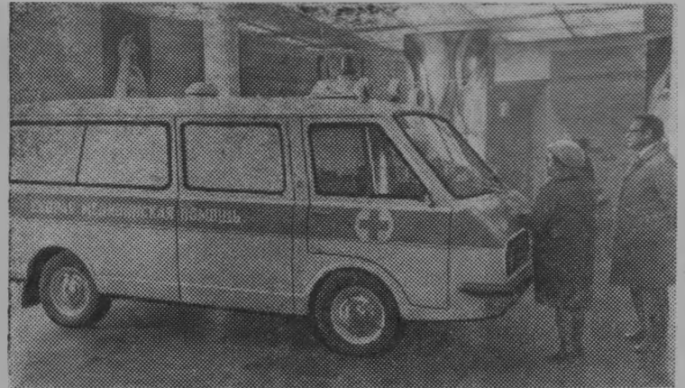
Москва. В павильоне «Здравоохранение» на ВДНХ СССР открыта выставка, посвященная перспективам развития советского здравоохранения на 1976—1980 гг.