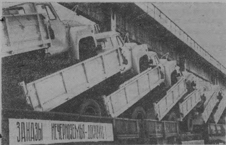
Киргизская ССР. Несколько сотен автосамосвалов отправил с начала года земледельцам Нечерноземной зоны Российской Федерации Фрунзенский автосборочный завод. Это предприятие выпускает машину ГАЗ-53Б, кузов которой позволяет сыпать грузы в любую из трех сторон, и самосвал САЗ-3502, платформа которого с помощью гидравлического устройства поднимается на высоту свыше трех метров и в этом положении опрокидывается.