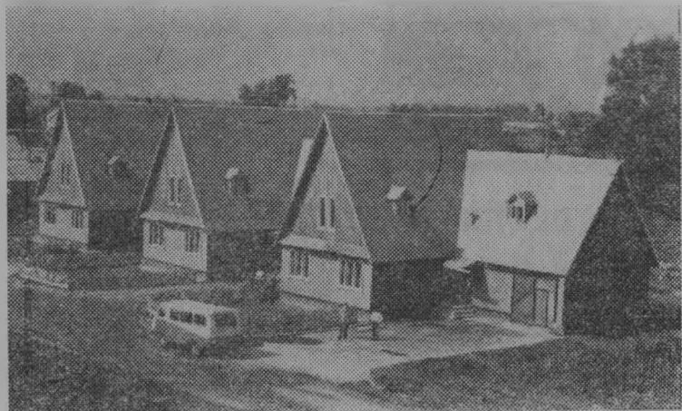
Марийская АССР. В колхозе «За коммунизм» Волжского района строятся экспериментальные жилые дома разных серий. Они помогут определить наиболее удобный тип жилья для массового строительства в других хозяйствах республики.