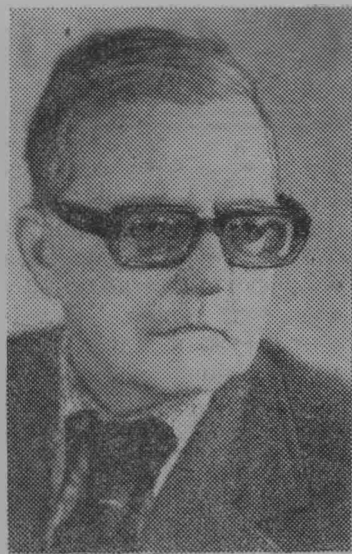
Д. Д. Шостакович

25 сентября исполняется 70 лет со дня рождения выдающегося советского композитора, пианиста, общественного деятеля Дмитрия Дмитриевича Шостаковича. (1906—1975).