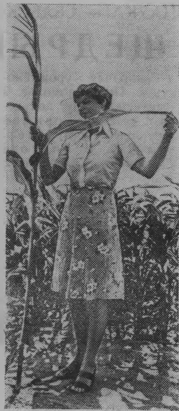
«Агротерм» — под таким названием в ФРГ проводится сейчас эксперимент по использованию в сельском хозяйстве избыточного тепла электростанций.

На снимке: кукуруза, получающая подогрев от ТЭС в Нойрате.