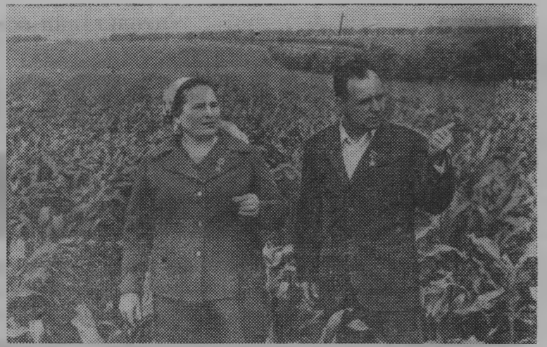
Украинская ССР. Крепкая дружба связывает тружеников сельского хозяйства Борщевского района Тернопольской области и Бершадского района Винницкой области. Участники Всесоюзного социалистического соревнования оказывают действенную помощь друг другу.

Недавно делегация Борщевского района побывала у своих друзей — соперников, познакомилась с успехами животноводов и механизаторов.