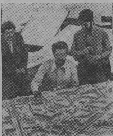
На завершившемся в Москве Всесоюзном конкурсе проектов сельских Домов культуры для Нечерноземной зоны

РСФСР первое место разделили московские архитекторы и авторский коллектив института «Ленпроект» из города на Неве.