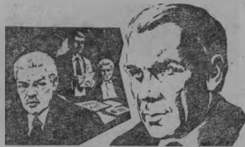
ЗДЕСЬ НАШ ДОМ

«Здесь наш дом» — кино-рассказ о буднях огромного современного завода, о новом, что входит в нашу жизнь и быт. Фильм поставлен по сце-