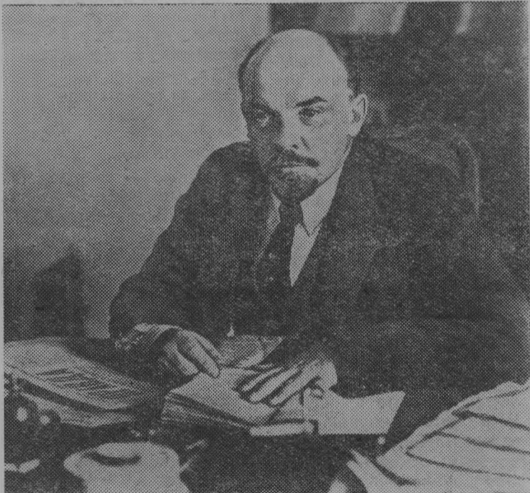
В. И. Ленин в своем кабинете в Кремле. Москва, октябрь 1918 года.

Определяя перспективы развития социалистической революции, Владимир Ильич говорил о том, что переход власти в руки пролетариата и беднейшего крестьянства даст невиданный в истории взрыв