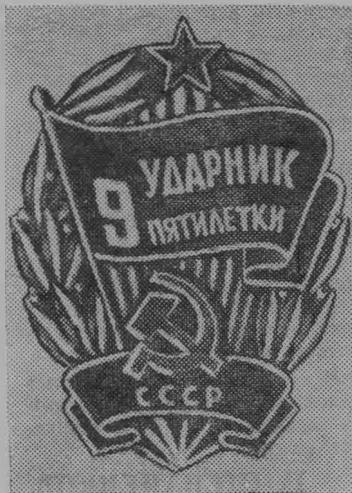
Знак «Ударник девятой пятилетки».

16 и 17 марта 1974 г. в районе объявляются ударными днями по вывозке щебня на дорогу «Тоншаево — Вякшенер».