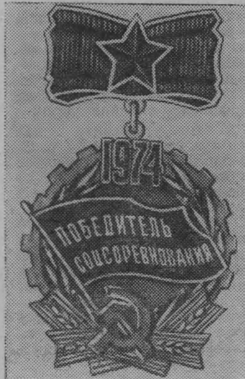
Знак «Победитель социалистического соревнования 1974 года».