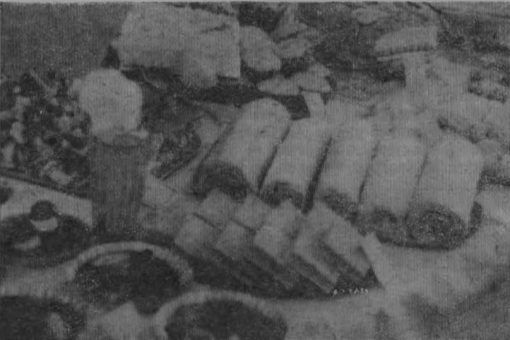
На любой вкус.