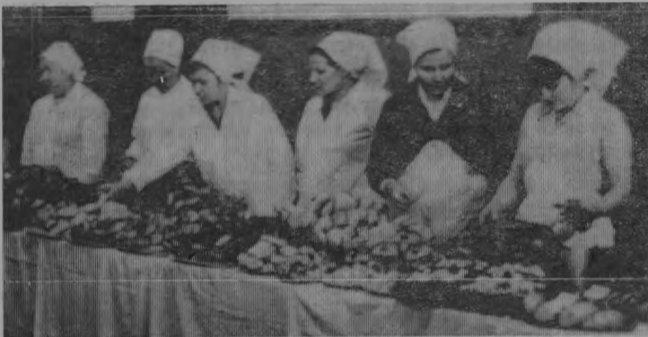
Выставка—это их труд.