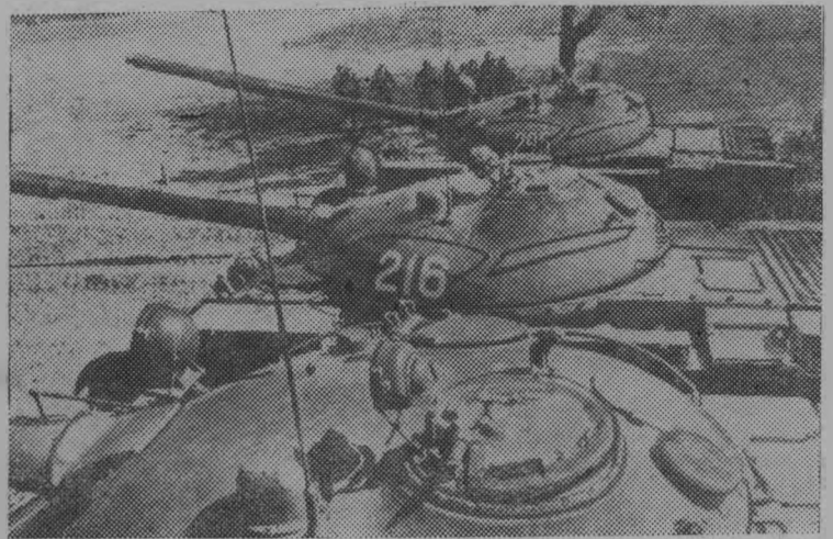
Сейчас взревет двигатели и танки устремятся вперед.