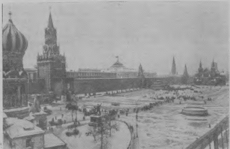
Москва сегодня. Красная площадь.

Если в первую декаду месячника в район завезли 1556 тонн, то во вторую всего — 80. Это объясняется тем, что в отдельные дни в Шахунье не было удобрений. Но они поступают. И в последнюю неделю месячника еще есть возможность выполнить планы каждому хозяйству. Нужно только к этому относиться серьезнее, потому что думать об урожае нужно сейчас.