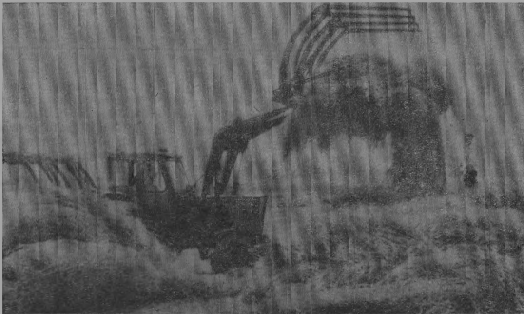
Механизированное скирдование сена.