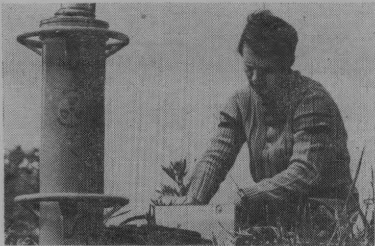
Москва. В 1975—90- годах в нечерноземной зоне РСФСР предусматривается осушение земель на площади 9—10 миллионов гектаров. Во Всесоюзном научно-ис-

следовательском институте гидротехники и мелиорации разработаны способы осушения болот и заболоченных земель закрытым, кротовым и щелевым дренажем. Специалисты института ведут работу по конструированию и внедрению автоматизированной системы управления строительством и эксплуатацией водохозяйственных комплексов и разрабатывают радиоизотопные приборы контроля влажности почвы на орошаемых и осушенных землях.