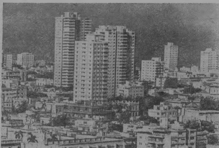
ГАВАНА—СТОЛИЦА ОСТРОВА СВОБОДЫ.