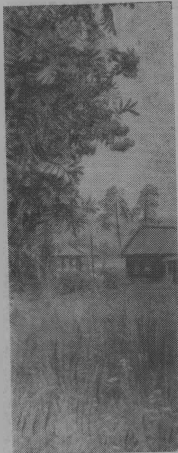
ЗРЕЮТ НАД ТЫНОМ ГРОЗДЬЯ РЯБИНЫ.