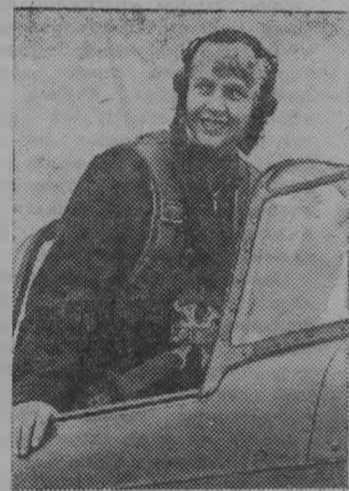
Тульский авиаспортклуб—один из старейших в стране. Ему исполнилось

46 лет. За это время здесь подготовлено немало разрядников и мастеров спорта. Под руководством опытных инструкторов юноши и девушки постигают секреты пилотирования, изучают парашютное дело, готовясь применить все это на практике.