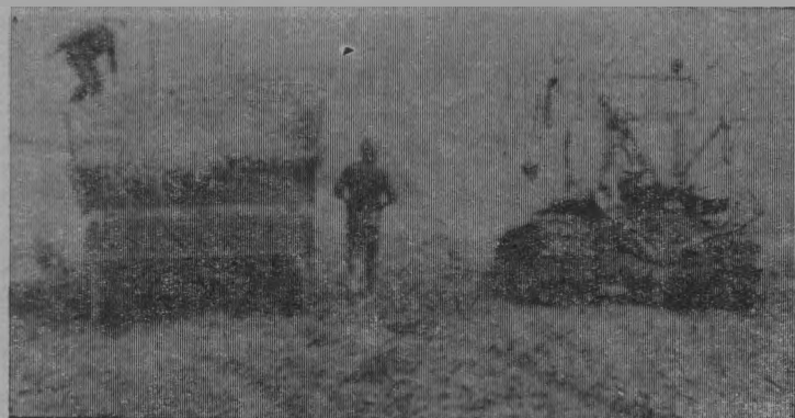
Трамбовка силоса в траншее.