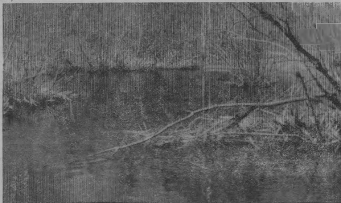
Разлив лесной речки Арши.