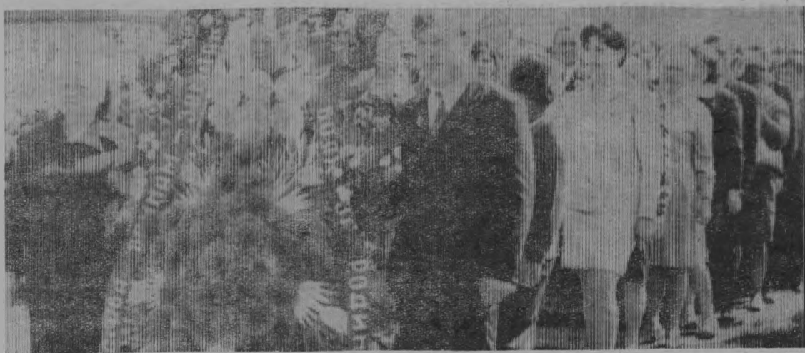
9 мая. р. п. Тоншаево. Возложение венков к памятнику воинам-землякам, погибшим в годы войны.

имени Кирова. Однако в колхозах «Путь Ленина», имени Свердлова, имени Ленина» совхозе «Прогресс» рост произошёл незначительный: одна-две головы. А в колхозе «Красная нива» за год произошло снижение численности коров на 12 голов. Руководители хозяйств, специалисты сельского хозяйства колхозов и совхозов должны понимать, что увеличение производства продукции животноводства невозможно без увеличения численности скота.