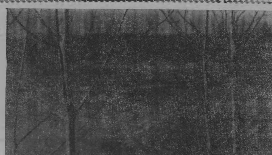
НА РЕКЕ ОШМЕ. С ВЫСОКОГО БЕРЕГА ОТКРЫВАЮТСЯ ДАЛИ ЗАЛИВНЫХ ЛУГОВ.