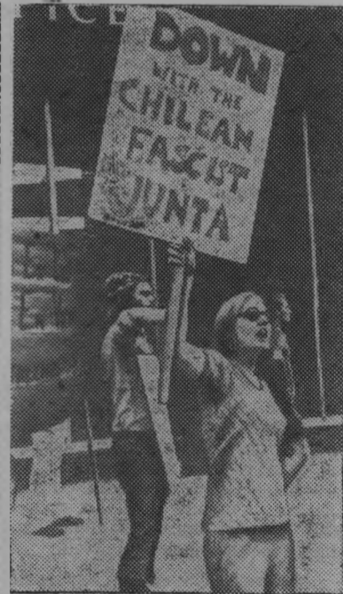
«Долой фашистскую хунту в Чили», — требуют эти молодые американцы.

Знания о происхождении болезни, а также вовремя принятые меры профилактики помогут предупредить заболевание и распространение инфекции.