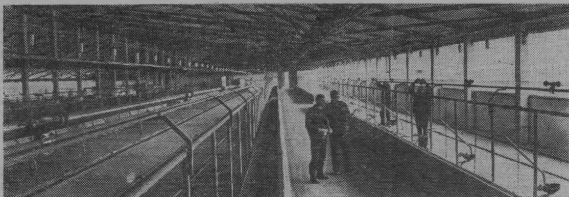
Московская область. Набирает мощность сельский строительный комбинат в Егорьевске.

С конвейера предприятия ежегодно сходят детали для 50 коровников на 200 и 400