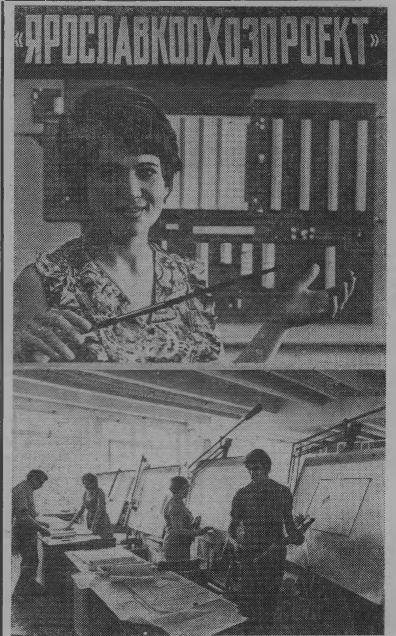
Ярославская область. Институт «Ярославколхозпроект» ведет разработку проектов крупных животноводческих комплексов, межрайонных комбикормовых заводов, птицефабрик, принимает участие в сооружении колхозных и совхозных поселков.

Большие планы у коллектива на 1975 год. Завершающий год пятилетки нам хочется отметить по-особому, крупными достижениями. Колхоз уже выполнил свой пятилетний план по продаже государству зерна, сахарной свеклы, мяса. Приложим все силы, чтобы в мае будущего года завершить пятилетку по продаже молока. Поставим государству за пятилетку 9 тысяч тонн молока. Это в два раза больше, чем было продано его в восьмой пятилетке. Удвоим также продажу государству зерна и мяса. Такова наша большая, но вполне реальная цель. Заметим, что решать эти задачи будем качественными факторами роста, повышением культуры и эффективности труда животноводов.