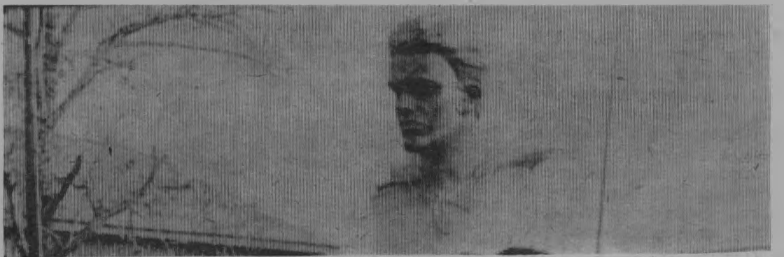
Бюст Героя Советского Союза И. Н. Шишмакова.