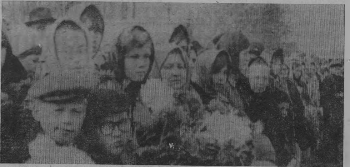
Люди пришли на площадь почтить память Героя.

полнил скульптор В. П. Малиновский. К делу он подошел творчески, с любовью. Архитектурные работы по созданию памятника выполнила группа Горьковских специалистов под руководством художника Я. Е. Карасика. Большую часть работ по благоустройству площади выполнила общественность поселка.