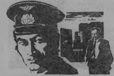
ВСТРЕЧИ И РАССТАВАНИЯ

На следующей неделе вы увидите новую работу молодых талантливых узбекских кинематографистов «Встречи и расставания». Действие происходит в одной из стран Западной Европы, где Рустам (артист Нагматуллин) пилот вертолета, участвует в строительстве высоковольтной линии в Альпах. Здесь он случайно встречает эмигрантов-узбеков, видит, как они живут, как тоскуют по покинутой когда-то Родине. И еще острее ощущает Рустам гордость за свою страну, за свой счастливый народ.