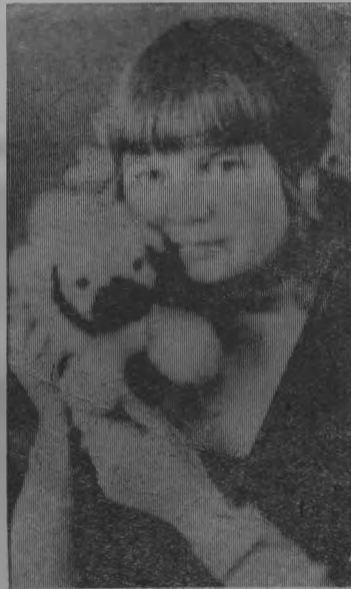
А с игрушкой не расстанусь.