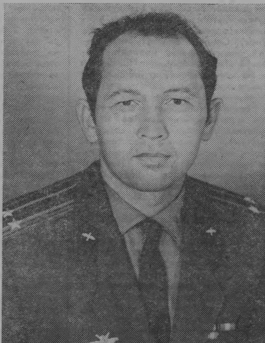
Командир космического корабля «Союз-15» подполковник Геннадий Васильевич Сарафанов. Бортинженер космического корабля

Работы на полях много. Приближается еще одна — уборка картофеля. Первые дни осени должны стать решающими на уборке урожая.