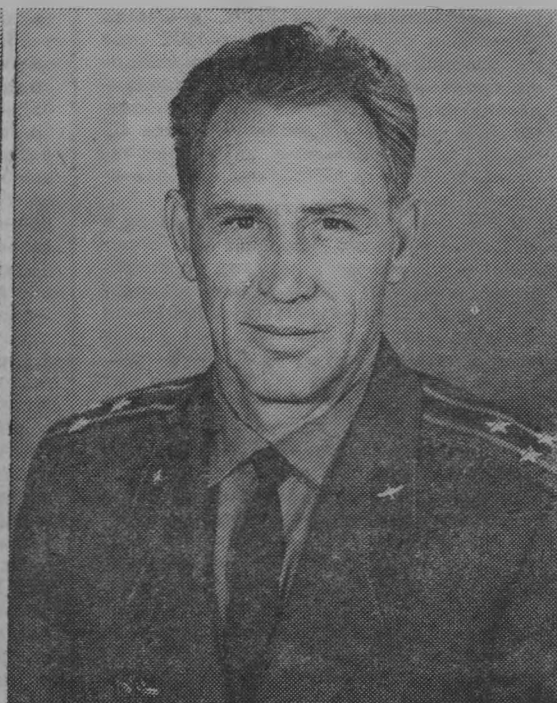
«Союз-15» полковник Лев Степанович Демин.