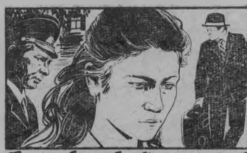
Здравствуй и прощай