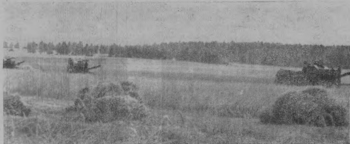
На снимке: уборка зерновых в колхозе имени Ленина.