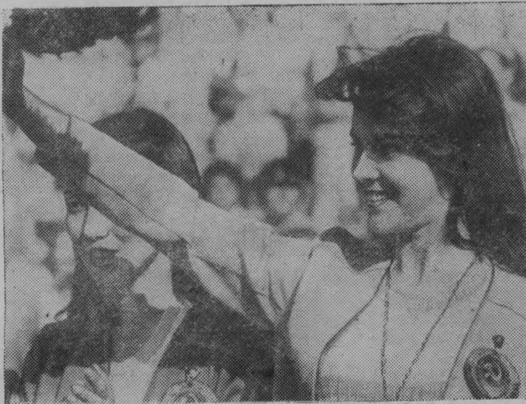
Посланцы советского комсомола на форуме юности мира.