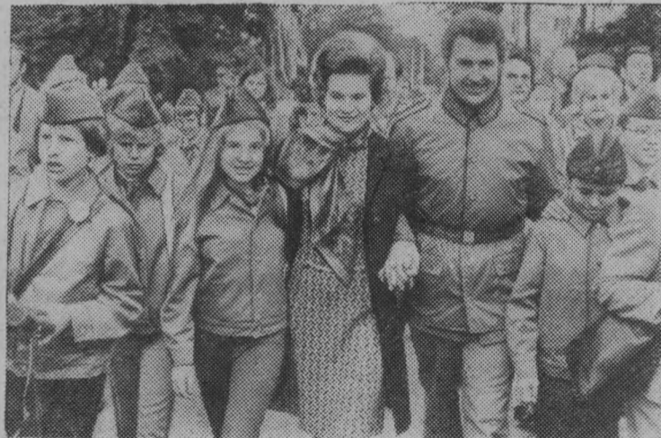
Почетный гость фестиваля, советский летчик-космонавт В. Николаева-Терешкова и первый секретарь Центрального совета Союза свободной не-