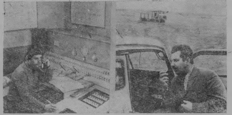
Винницкая область. Колхоз XII-лет Октября—многоотраслевое передовое хозяйство в Бершадском районе. Здесь создана диспетчерская служба, оснащенная современной аппаратурой. Имеется двухсторонняя радио- и телефонная связь со всеми бригадами, ремонтными мастерскими, животноводческими фермами.