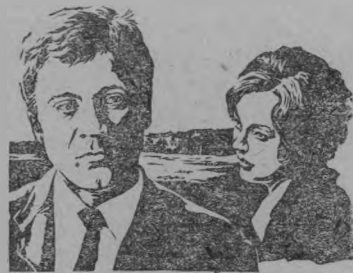
ЧЕЛОВЕК НА СВОЕМ МЕСТЕ

На будущей неделе в Тоншаевском, Шайгинском, Ошминском Домах культуры и кинотеатре «Нива» начнется премьера нового цветного художественного фильма «Человек на своем месте». Мы не будем здесь полностью раскрывать содержание этого интересного фильма, только скажем, что он рассказывает о людях современной колхозной деревни, о новом типе председателя колхоза, решившем вести хозяйство по-новому.