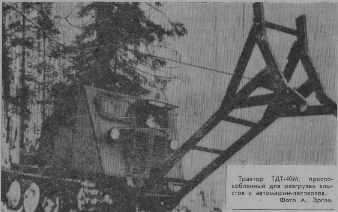
Трактор ТДТ-40М, приспособленный для разгрузки хлыстов с автомашин-лесовозов.