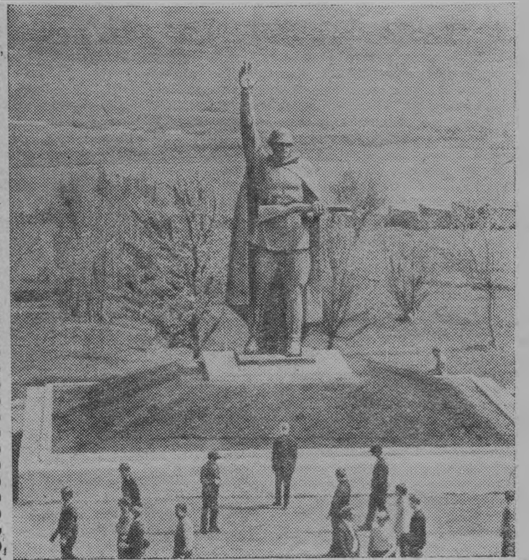
Монумент воина-победителя, установленный в Свободинском мемориале-музее Курской битвы.

(к 30-летию начала сражения 5 июля 1943 г.)