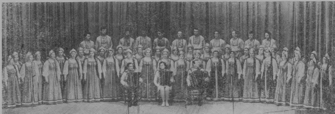
Ниров. В областном смотре сельской художественной самодеятельности, посвященном 50-летию образования СССР, принимали участие две с половиной тысячи человек из 39 районов. Большое место в программе заняли номера националь-

ных коллективов области—татарских, мордовских, марийских.