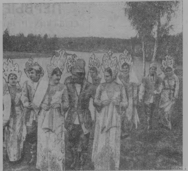
Иваново. Народный ансамбль танца «Балалаечка» при дворце культуры Ивановского меланжевого комбината пользуется большой популярностью.

П. ТОМАРОВ, секретарь партийной организации совхоза.