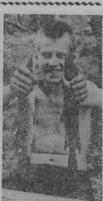
Вот это улов!