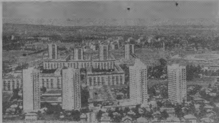
НРБ. Новый жилой район «Борово» в Софии.