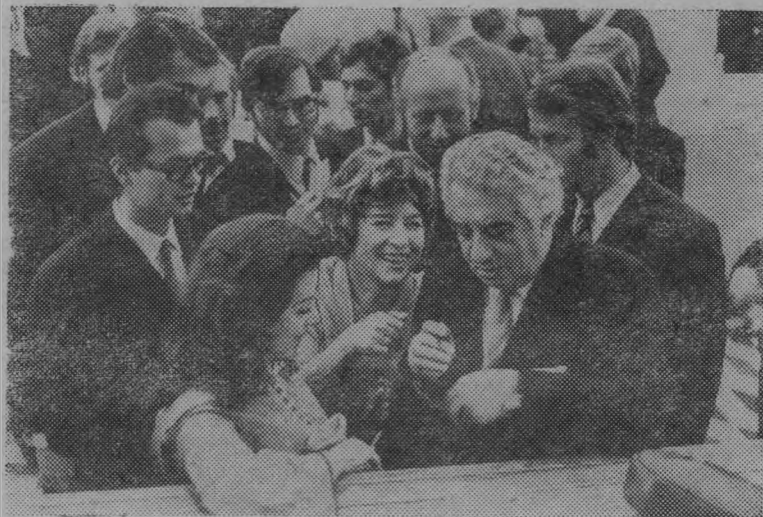
Это — и ее природа, и виды городов, и заводы и строящиеся ГЭС...

На выставке представлены портреты героев труда — рабочих и колхозников, деятелей науки и искусства, представителей разных национальностей. Она показывает нашу страну от восточных меридианов до западных, от северных широт до южных.