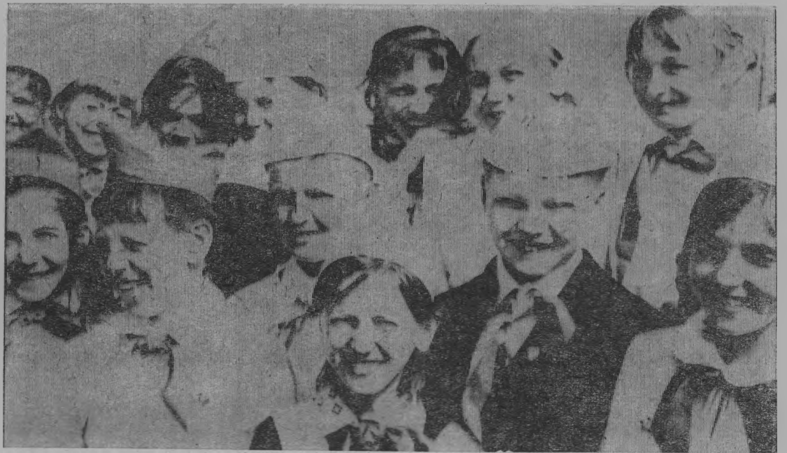
Смотришь на эти веселые лица ребят и сразу вспоминаются слова из пионерской песни: «Эго чей там, смех веселый, чьи глаза огнем горят. Это смена комсомола — юных ленинцев отряд!»