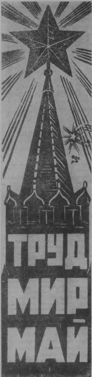
Плакат издательства „Московская правда“.

Да здравствует 1 Мая — День между- народной солидар- ности трудящихся в борьбе против им- периализма, за мир, демократию и со- циализм!