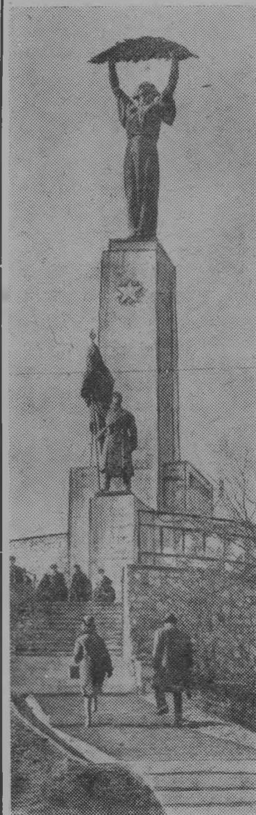
У монумента Освобождения на горе Геллерт в Будапеште. На его цоколе вырезаны имена советских героев, отдавших свою жизнь в боях за венгерскую столицу.