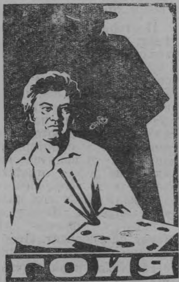
ГОЙЯ или тяжкий путь познания

Успеху фильма, без сомнения, способствует интересный