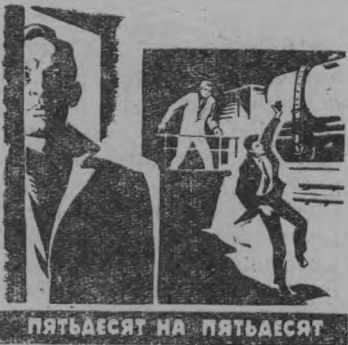
ПЯТЬДЕСЯТ НА ПЯТЬДЕСЯТ

Двухсерийный фильм «Гойя или тяжкий путь познания» поставлен по мотивам одноименного романа Лиона Фейхтвангера. Главную роль в картине исполняет популярный