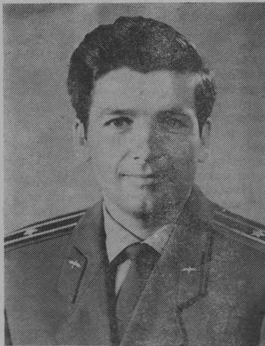
Командир космического корабля «Союз-13» Петр Ильич Климуk.