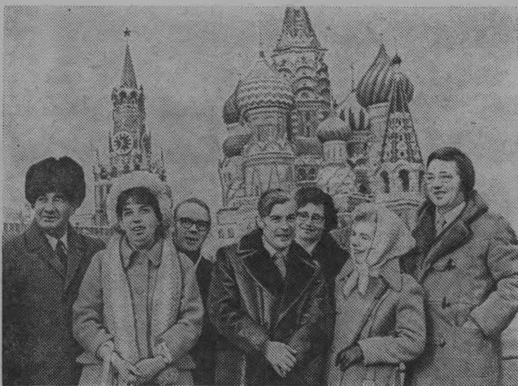
Москва. 25 октября. Всемирный конгресс миролюбивых сил.

Совет Министров СССР постановил перенести день отдыха с воскресенья 11 ноября на пятницу 9 ноября 1973 г.