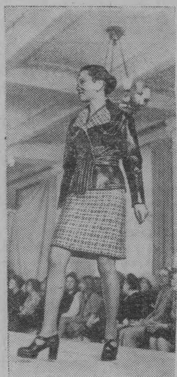
Москва. Три основных направления современной моды прослеживаются в осенне-зимней коллекции одежды Общества Дома моделей, разработанной с перспективой на 1974 год: в линии покроя будут преобладать полуприлегающий, прямой и трапециевидный силуэты.

На снимке: крестьяне на улице Исфагана.